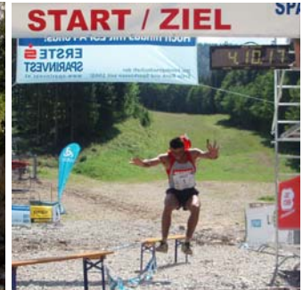
Freudensprung ins Ziel